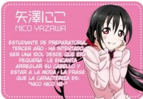
矢澤にこ NICO YAZAWA

ESTUDIANTE DE PREPARATORIA PRIMER AÑO · TIENE UNA PERSONALIDAD MUY TÍMIDA, Y NO ES BUENA PARA LAS APARICIONES PÚBLICAS · SU COMIDA FAVORITA ES EL ARROZ · SE PREOCUPA POR SU PESO.