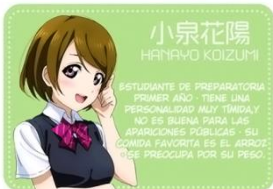
小泉花陽 HANAYO KOIZUMI

ESTUDIANTE DE PREPARATORIA SEGUNDO AÑO · ES AMIGA DE LA INFANCIA DE UMI Y HONOKA · DECIDIÓ SER IDOL POR INVITACIÓN DE HONOKA · ES BUENA PARA LA COSTURA, Y ES LA ENCARGADA DE CONFECCIONAR LOS TRAJES DEL GRUPO.