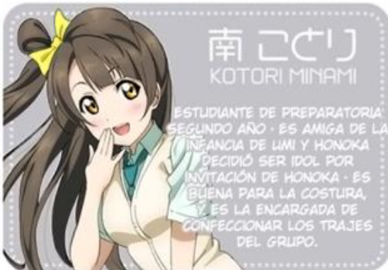
南ことり KOTORI MINAMI

ESTUDIANTE DE PREPARATORIA PRIMER AÑO · ES BUENA TOCANDO EL PIANO, Y ES LA ENCARGADA DE COMPONER LA MÚSICA DEL GRUPO · HIJA ÚNICA DE UNA FAMILIA ADINERADA · SUS PADRES DIRIGEN UN HOSPITAL · ES INTELIGENTE, Y SUS CALIFICACIONES SON UNAS DE LAS MÁS ALTAS.