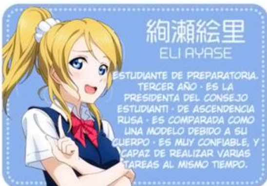
絢瀬絵里 ELI AYASE

ESTUDIANTE DE PREPARATORIA TERCER AÑO · LE GUSTA LAS COSAS RELACIONADAS CON LO ESPIRITUAL · TAMBIÉN DENOMINADA LA "LÍDER ESPIRITUAL" DEL GRUPO · EL TAMAÑO DE SUS PECHOS ES EL MÁS GRANDE DEL GRUPO.