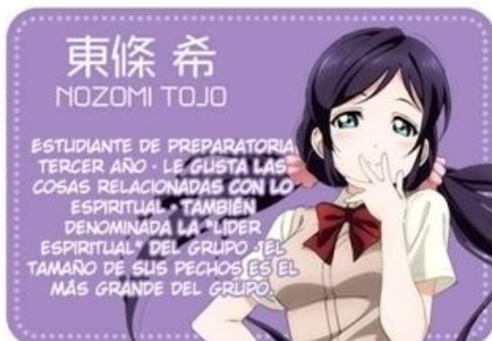
東條 希 NOZOMI TOJO

ESTUDIANTE DE PREPARATORIA TERCER AÑO · HA INTENTADO SER UNA IDOL DESDE QUE ERA PEQUEÑA · LE ENCANTA ARREGLAR SU CABELLO Y ESTAR A LA MODA · LA FRASE QUE LA CARACTERIZA ES: "NICO NICO NIH"