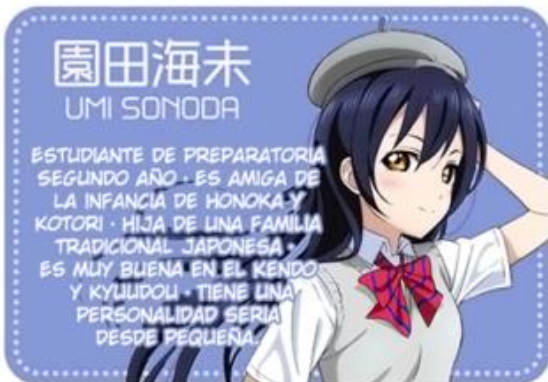
園田海未 UMI SONODA

ESTUDIANTE DE PREPARATORIA SEGUNDO AÑO · ES AMIGA DE LA INFANCIA DE KOTORI Y UMI · ES LA LÍDER DEL GRUPO · SU FAMILIA TIENE UNA TIENDA DE DULCES JAPONESES, LLAMADA HONMURA · ES SEGURA DE SI MISMA · TIENE UNA HERMANA MENOR: YUKIHO