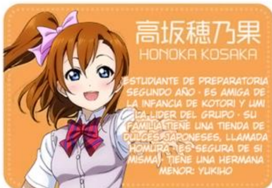
高坂穂乃果 HONOKA KOSAKA

ESTUDIANTE DE PREPARATORIA SEGUNDO AÑO · ES AMIGA DE LA INFANCIA DE KOTORI Y UMI · ES LA LÍDER DEL GRUPO · SU FAMILIA TIENE UNA TIENDA DE DULCES JAPONESES, LLAMADA HONMURA · ES SEGURA DE SI MISMA · TIENE UNA HERMANA MENOR: YUKIHO