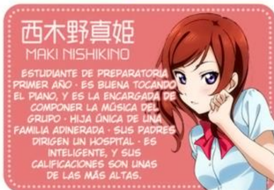
西木野真姫 MAKI NISHIKINO

ESTUDIANTE DE PREPARATORIA SEGUNDO AÑO · ES AMIGA DE LA INFANCIA DE HONOKA Y KOTORI · HIJA DE UNA FAMILIA TRADICIONAL JAPONESA · ES MUY BUENA EN EL KENDO Y KYUJUDOU · TIENE UNA PERSONALIDAD SERIA DESDE PEQUEÑA